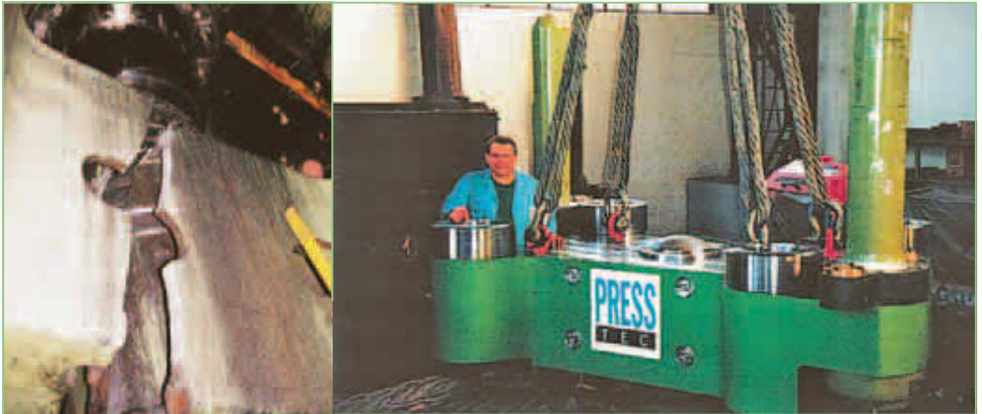
Unterflurschmiedepresse (12 MN): Bauteilbruch und neues Ersatzteil

Während der Phase der Notreparatur erfolgt auch die Bestandaufnahme vor Ort: Hierzu gehören z. B. die Maßaufnahme und -überprüfung, Metallurgische Prüfungen und Ermittlung der Ursachen, die zum Versagen geführt haben, die am Betreiber und/oder dem Aggregat selbst liegen. Im Werk Kehl erfolgt die konstruktive Begutachtung mit entsprechenden FEM- und bruchmechanischen Analysen.