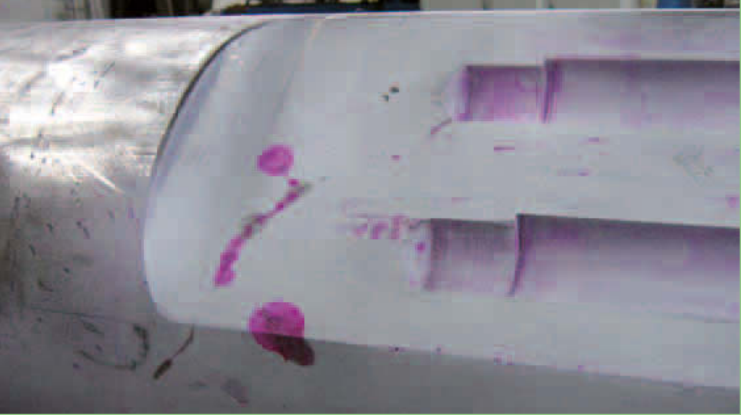
Gerissener Vierkant einer 10 MN Eumuco Exzenterwelle